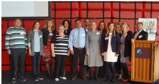
Среща на партньорите и заключителна конференция в Ротердам на 28-ми, 29-ти и 30-ти септември 2015

Eğitim ve Gençlik Çalışmaları (Турция) счита, че е партньорството в проект Stay IN по програма Леонардо да Винчи е важно в много аспекти, не само за организацията, но и за страната. Отпадането от училище е проблем, който се разглежда сериозно през последните години. Проектът води до промяна в мисленето относно намаляване на отпадането. Най-важното нещо е, че благодарение на STAY IN съзнанието на педагозите, участвали в проекта, значително се промени. Още от самото начало има нарастващ интерес на учители, училища, фирми и мениджъри. Друг важен момент е, че ние вече имаме разработени полезни образователни и дидактически материали. Нашите членове са горди, че организацията ни участва в такъв важен проект. Ние наистина се чувстваме много успешни и щастливи да участваме в разработката на дидактически материали на ЕС ниво.