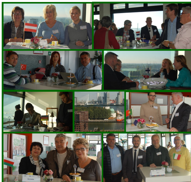
Националните дискусии на конференцията в Ротердам на 29 септември 2015

Разработеният Наръчник по 4-те теми, ще бъде разпространен във всички училища на хартиен носител и ще бъде достъпен за свободно изтегляне от нашия уеб сайт, така че учителите да могат да го използват за самоусъвършенстване на техните умения и знания. Ние като организация натрупахме опит в такъв тип проекти и ще се радваме да бъдем избрани като партньори и в други проекти, свързани с професионално образование и обучение.