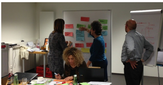
Incontro dei partners a Graz il 16-17 gennaio 2014