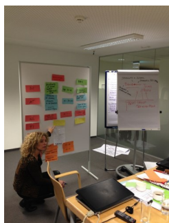
Foto scattate durante il primo incontro dei Partner a Graz, il 16-17 gennaio 2014

Il 16 e 17 Gennaio 2014 partner tenuto il primo incontro del progetto a Graz (Austria). Durante l'incontro tutti i partner hanno presentato brevemente le loro attività. Il coordinatore del progetto ha presentato Stay IN in dettaglio: il motivo del progetto, le principali finalità e gli obiettivi, così come i vari workpackage e il ruolo di ciascuna organizzazione partner nell'ambito del partenariato. I due progetti di trasferimento (School Inclusion e CESSIT) sono stati inoltre illustrati al consorzio da parte dei partner promotori. I gruppi di riferimento per le attività di Stay IN sono stati definiti come segue: dirigenti scolastici; insegnanti scolastici; formatori nelle imprese; assistenti sociali; genitori; studenti di scuola; "neets". Si è deciso di coinvolgerli nella raccolta di cinque interviste e 50 questionari per paese, che a sua volta fungeranno da base per le relazioni nazionali che analizzano i bisogni e requisiti di ciascun paese partner. Bozze di modelli per interviste, per il questionario e per la relazione sono state presentate nel corso dell'incontro.